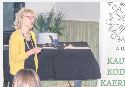
Kuimetsa külanõmme liris Saluri esines küladeõhtul ettekandega „Vabatahtlik külanõmme – kae, milline rõõm“.