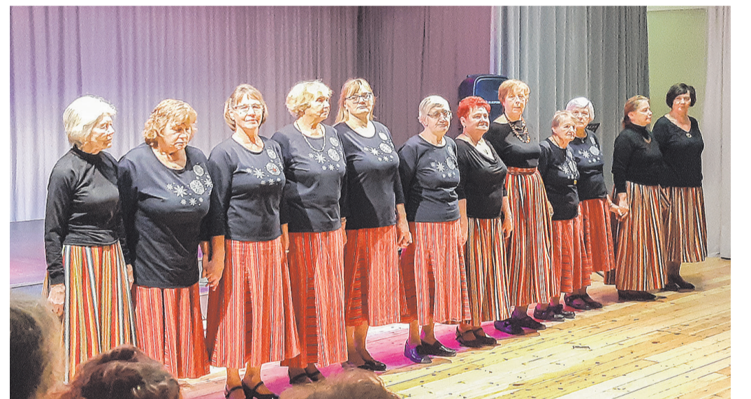
Lelle tantsurühm Kesalill ja Kehtna rühm Tabatinnad.