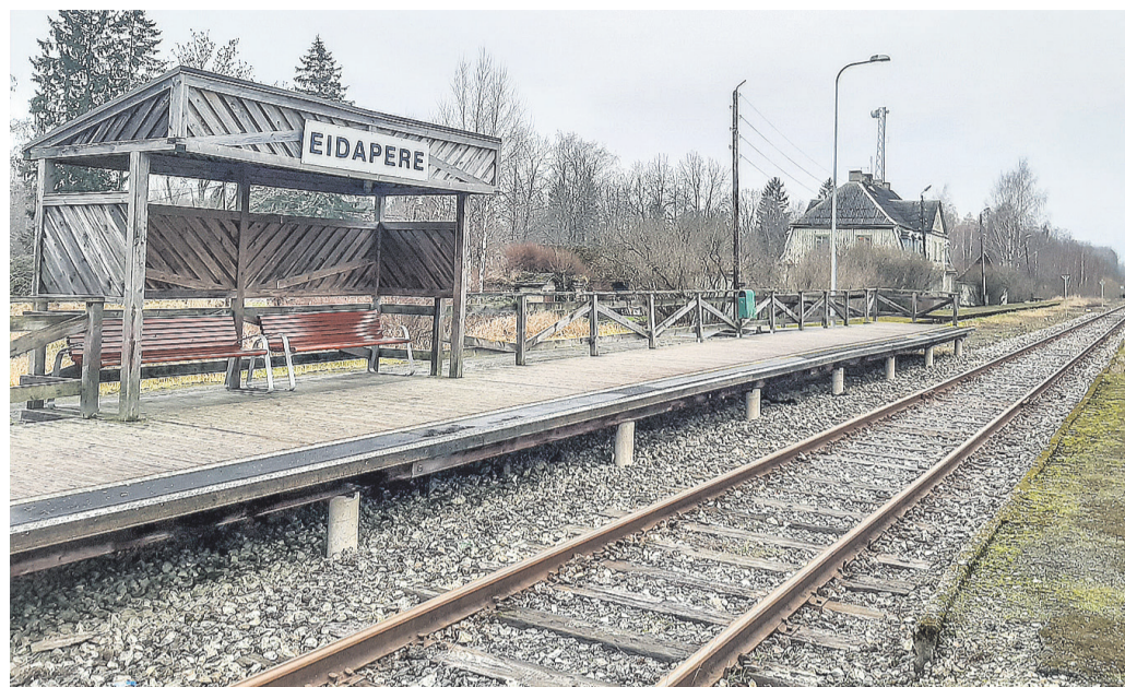
Viimane rong läbis Eidapere jaama 8. detsembril 2018.

Sulgemise põhjuseks toodi Pärnu–Lelle raudteeliikluse tehniline seisund, mis olevat olnud juba sedavõrd kehv, et selle parandamine polnud enam majanduslikult mõttekas. Tänavu suvel selgus aga, et osatükk Rail Baltic hakkab kõnealust trassi remontima, et kiirraudtee ehitusele materjale vedada. Samas pole sellest maarahvale suurt kasu, sest reisirongiliikluse taastamisest Lelle–Pärnu