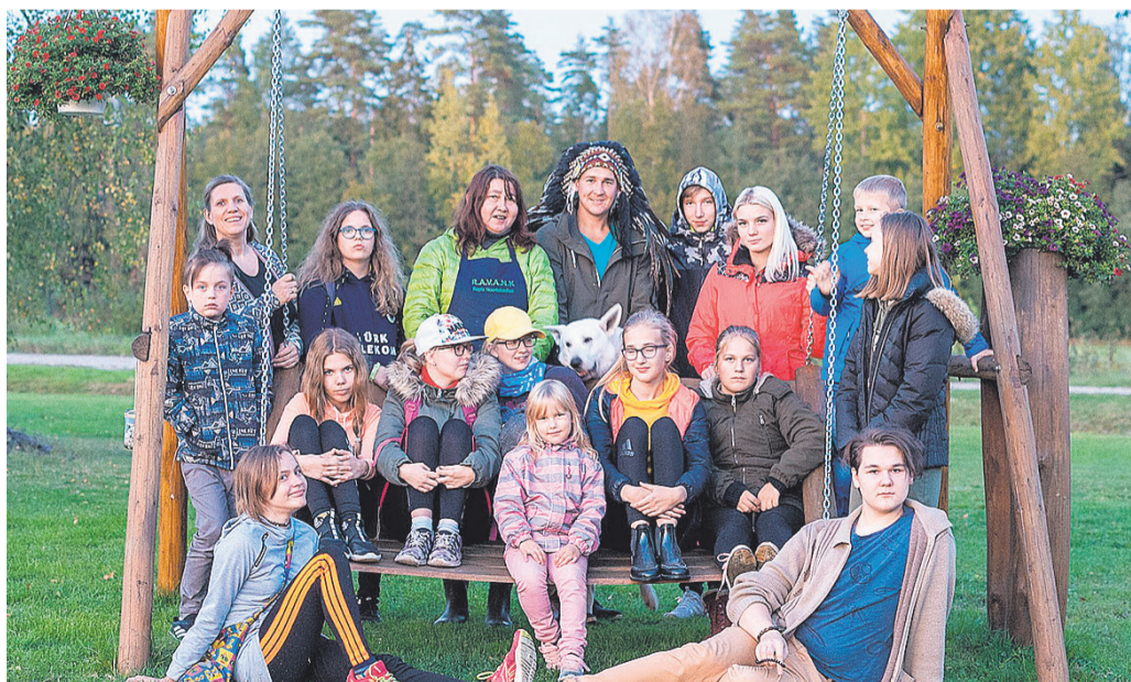
Noored koos Indiaanikülas kokkamas.

Kokku oli tulnud 20 noort. Meid võtsid vastu Indiaaniküla