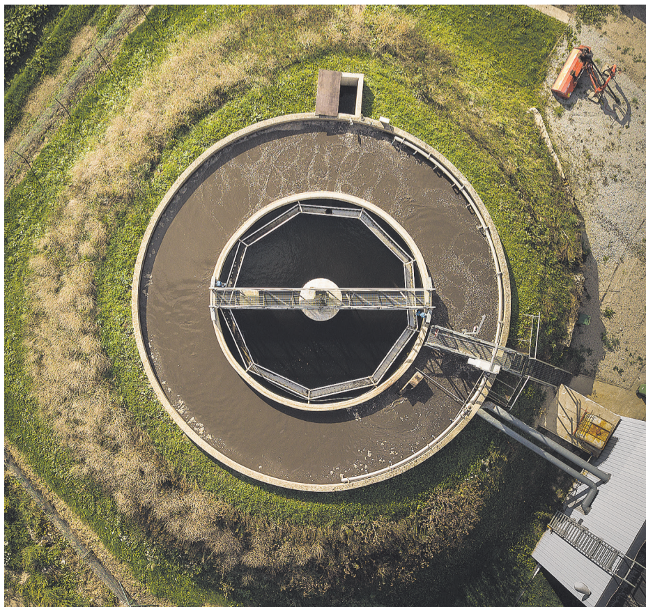
Ikooniliseim arhitektuurifoto – Villu Pihlakas „Kehtna reoveepuhasti“.