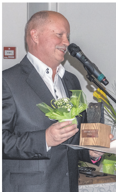
Haridustegu 2019 - Varri Väli. Ühe Päeva Ülikool