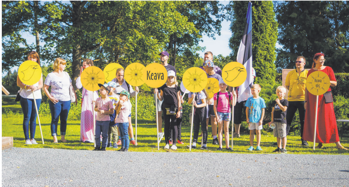
Rongkäik on jõudnud raamatukogu juurde.