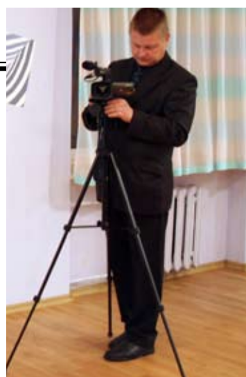
Foto- ja videoteenus Era- ja firmaürituste filmimine ning montaaž. Diapositiivide ja fotode skaneerimine ning kirjutamine cd-le. WHS filmide kirjutamine DVDle. www.kredor.ee Tel 511 7345

Müüa heas korras 3-toaline korter Kaereperes Männiku põik 1 Hind 640 000.- Täpsemat informatsiooni saab telefonilt +372 5341 9611