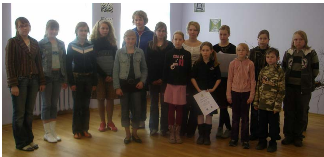
Pildil on võitnud lapsed