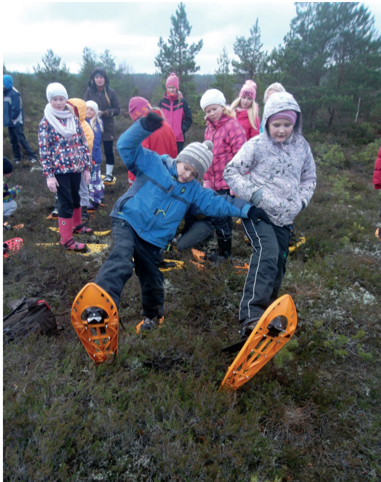
Kui rabamatkal rätsad püsti, on hea, kui kõrval kaaslane, kellele toetuda.