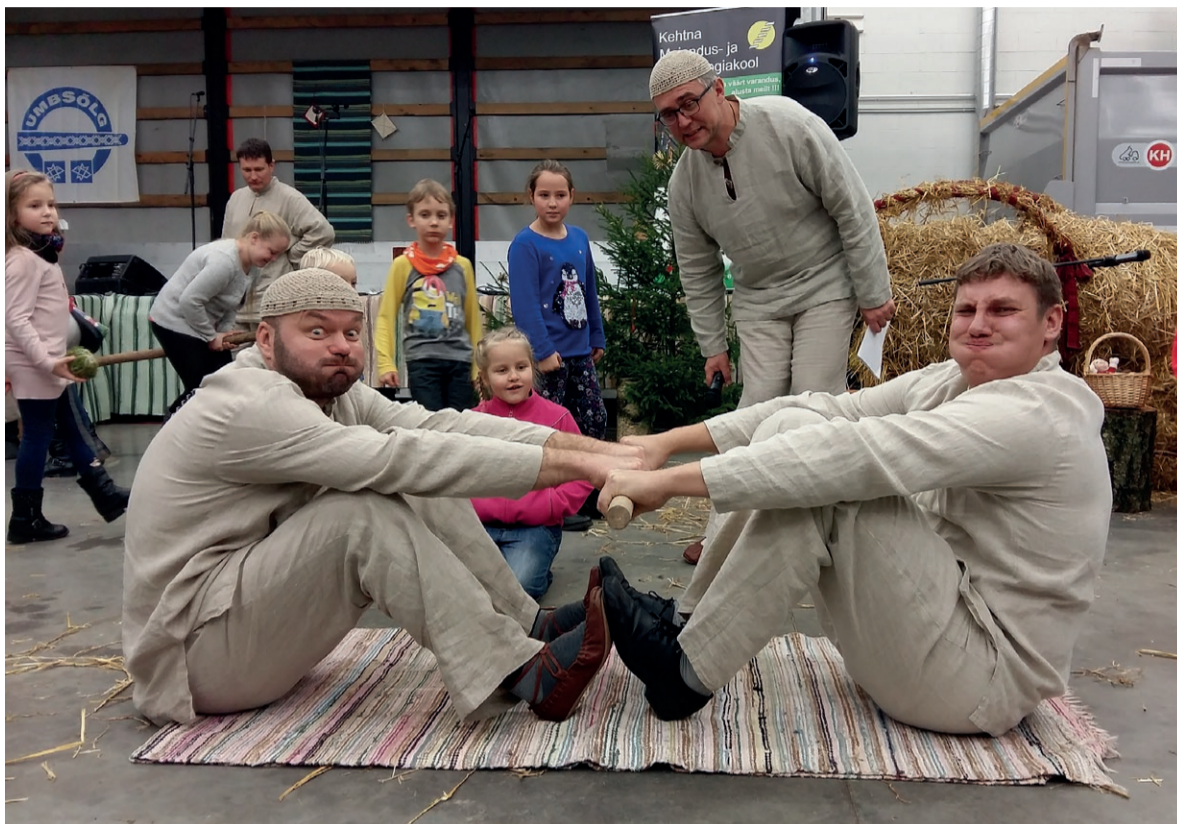
Vägikaikavedu on lihtne ja lõbus rahvalik mäng. Umbsõle meestantsijad näitasid ette, kuidas üks tõeline jõukatsumine käib.