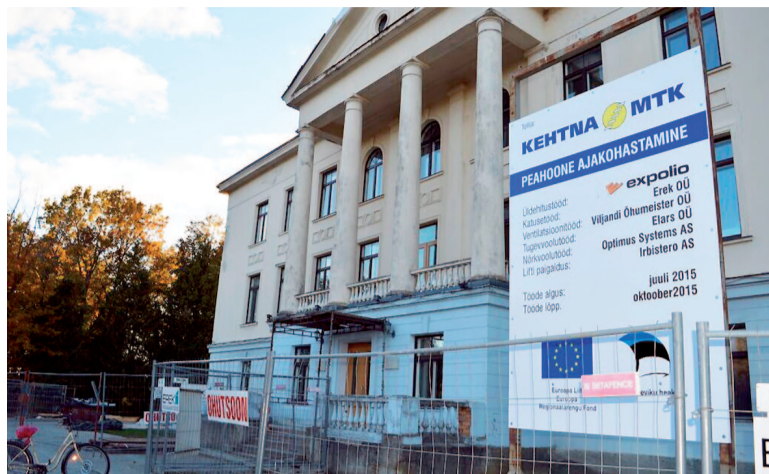
Peamaja fassaadi ümbritsevad ehitustööde ajal piirdeaiad.

Renoveerimistööde lõpuga käesoleva aasta lõpus kooli peamaja veel nii-öelda päris valmis ei saa. Jääb veel üks etapp: siseviimistlus (põrandad, uksed, seinad) ja uue mööbliga varustamine. Muudetakse veidi ka ruumiprogrammi. Samuti