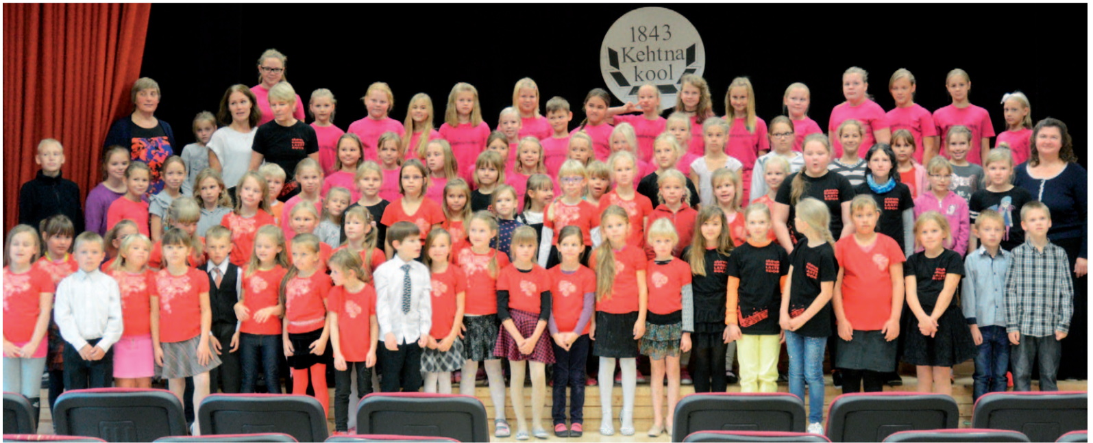
Laul teeb rinna rõõmsaks: üheskoos Valtu, Kehtna ja Järvakandi mudilaskoorid, Kehtna kunstide kooli pilliõpilased ja õpetajad.