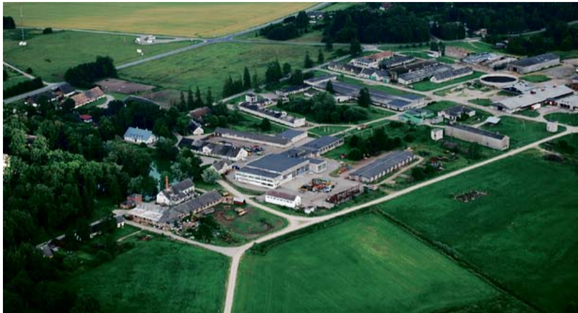
Kehtna Mõisa tootmiskompleks pilvepiirilt vaadatuna.

Tänaseks on nimetatud farmid loomi täis, müüme piima üle 17 tonni päevas. Kehtna Mõisa OÜ on ajastanud piimatootmise laiendamise Euroopa Liidu piimakvootide keh-