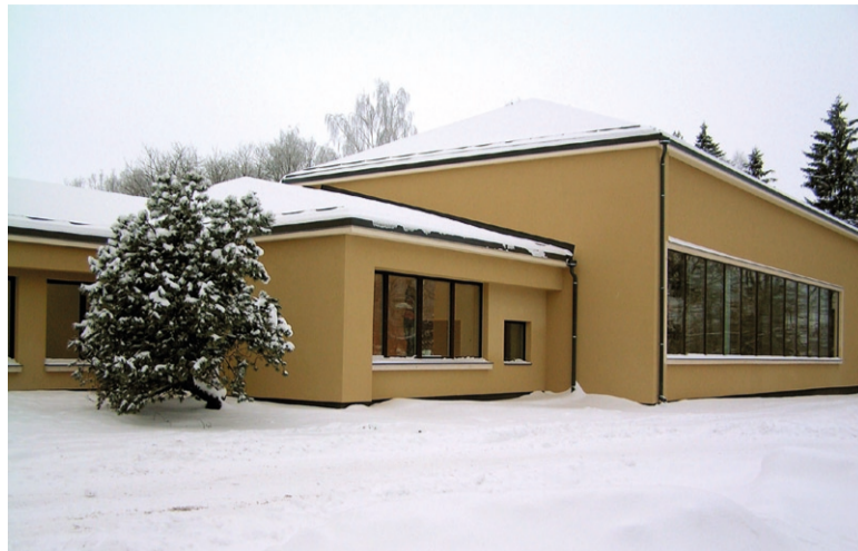
Vaade peamaja renoveeritud võimlaosale.

Peamaja renoveerimistööde käigus rekonstrueeriti soojatrassi osa, mis