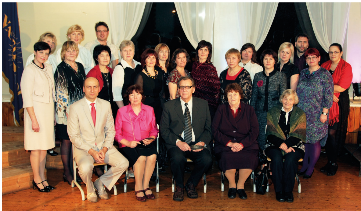
Valtu kooli endised ja praegused töötajad.