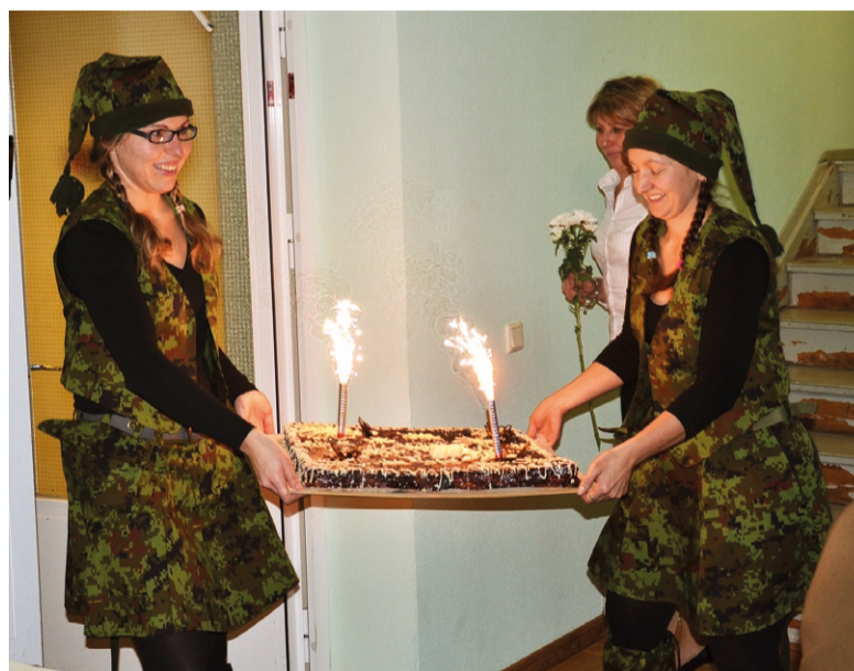
Omamoodi tegelased – kergelt militaarsed, päkapikulaadsed õhtujuhid.

Pidu oli tore ja meelde jääv tänu vahvatele osalejatele. Siiski - naiskodukaitse tegemised ei piirdu ainult ühiste pidudega, kuid nalja ja positiivseid emotsioone saab igast meie üritusest. Naiskodukaitse on