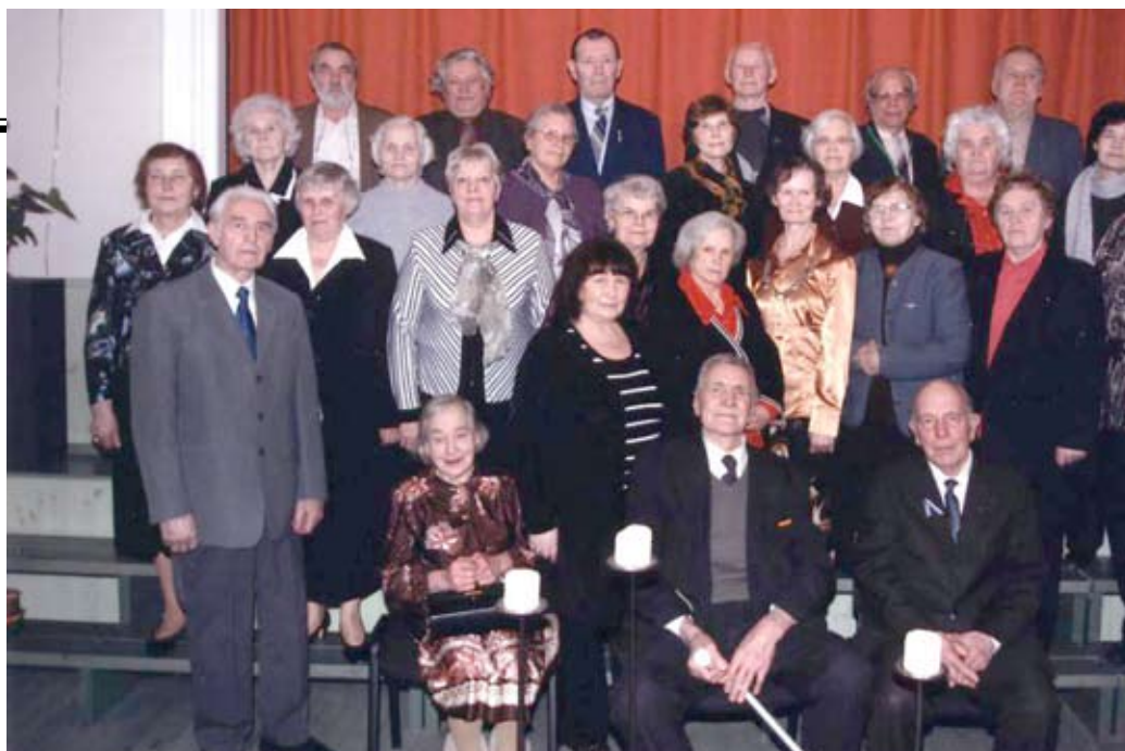
Aare Hindremäe foto