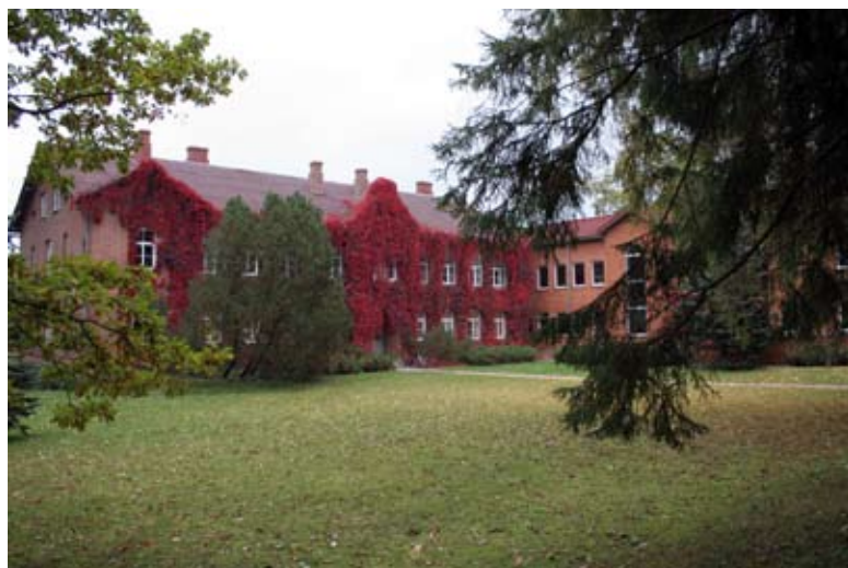
Valtu Põhikool – aktus 1. septembril kell 9.00