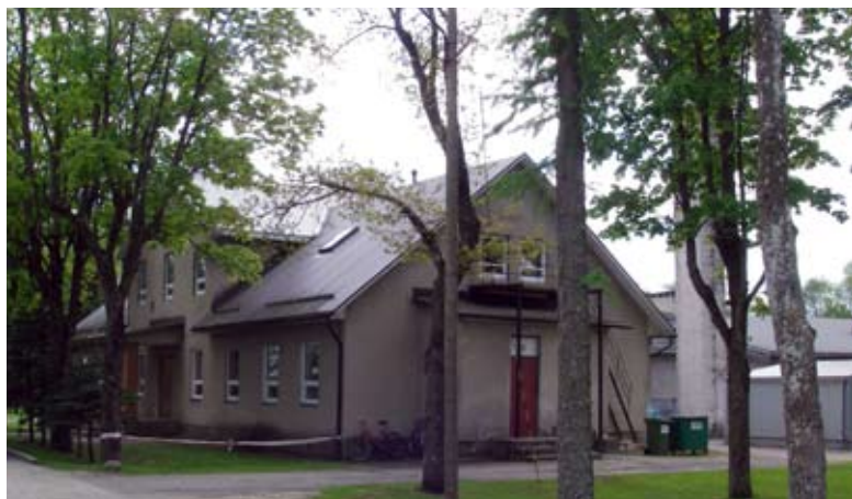
Lelle Kool – avaaktus 1. septembril kell 9.00