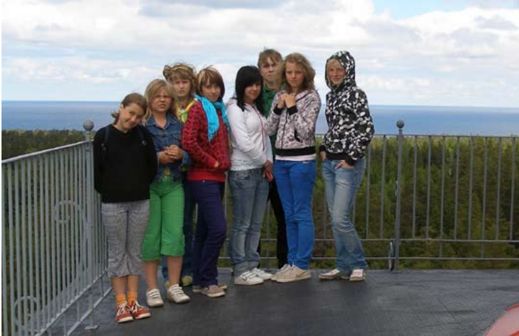
Laagriseltskond Kõpu tuletornis.

Meretuuline ja suvevärviline näitus tervitab algaval kooliaastal kõiki, kes Kehtna Kunstide Kooli sisse astuvad. Uudistada saab aruandenäitust kunstiõpilaste suvepraktikatöödest.