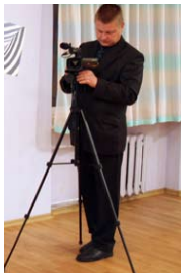
Foto- ja videoteenus Era- ja firmaürituste filmimine ning montaaž. Diapositiivide ja fotode skaneerimine ning kirjutamine cd-le. WHS filmide kirjutamine DVDle. www.kredor.ee Tel 511 7345