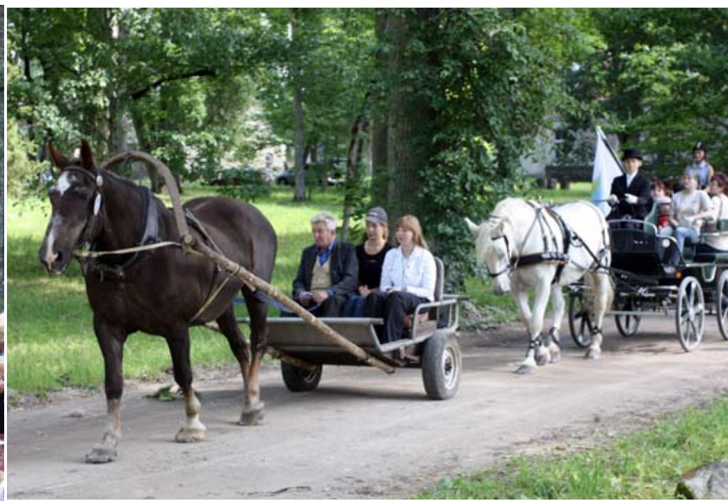
Pildid 19. juulil Inglistel peetud perepäevast