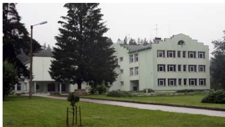
Kehtna Põhikool – aktus 1. septembril kell 9.00