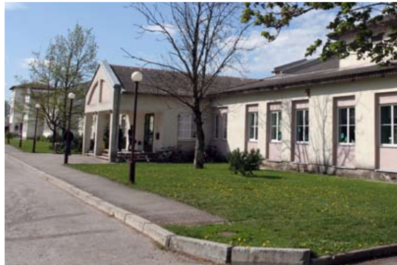
Eidapere Põhikool – aktus 1. septembril kell 9.00